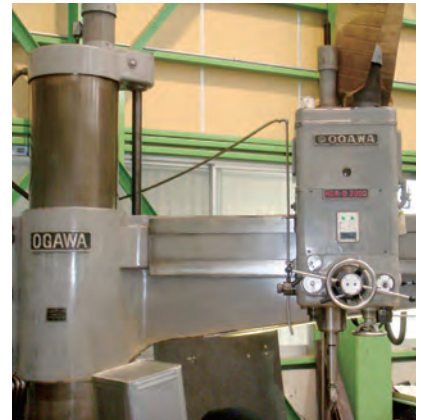
HDR-D2000／小川鉄工株式会社 テーブル：2000mm