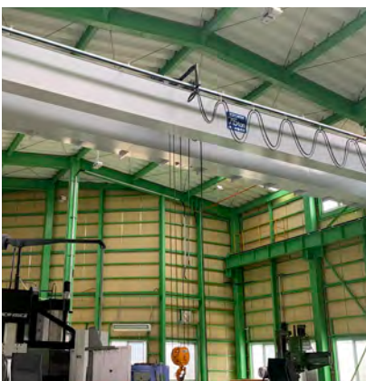
ホイスト式天井クレーン 三菱電機 FA産業機器株式会社 7.5800t／5.0420t