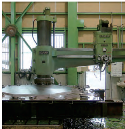
HDR-D2500／小川鉄工株式会社 テーブル：2500mm