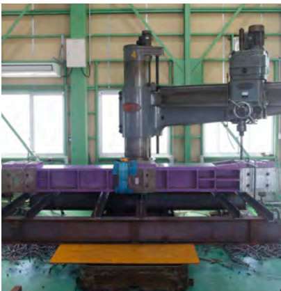
DRA-J1600／オークマ株式会社 テーブル：1600mm