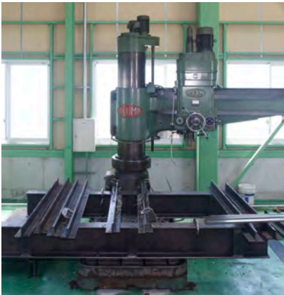
DRA-J2500／オークマ株式会社 テーブル：2500mm