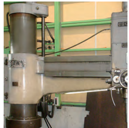
HDR-D1700／小川鉄工株式会社 テーブル：1700mm