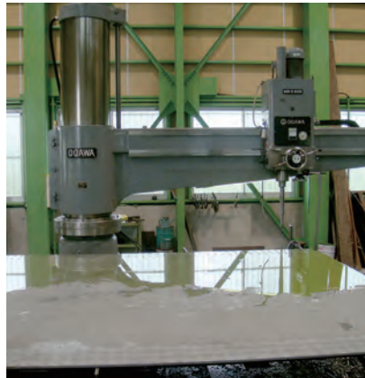
HDR-D3000／小川鉄工株式会社 テーブル：3000mm