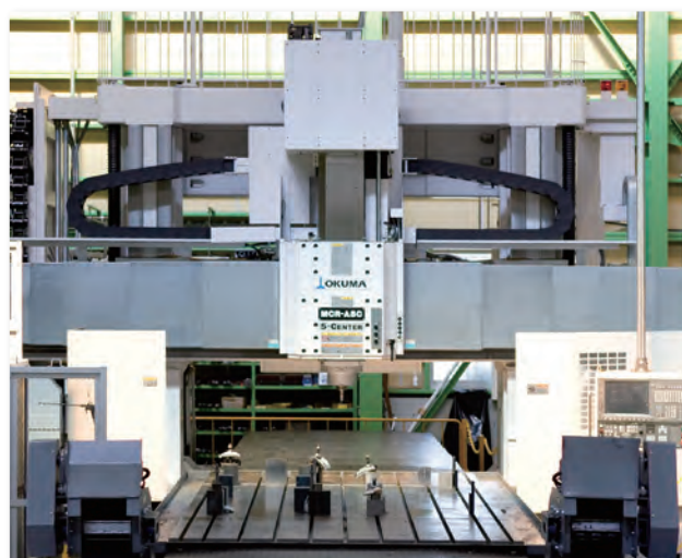
MCR-A5C (25) / オークマ株式会社 テーブル: 2500×4000mm